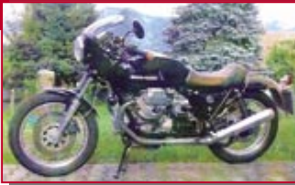
Typ: Moto Guzzi Le Mans, 1000 ccm, 70 PS Pabst, Artur D Ort: Sonthofen