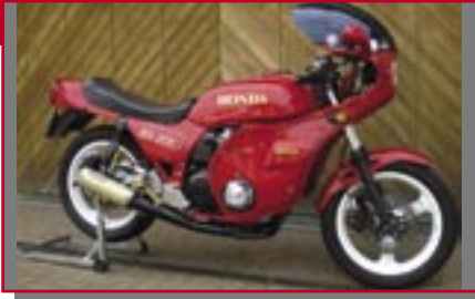
Typ: Honda CB 750 Bol d'Or, 1100 ccm, 100 PS Baujahr: 1979 M Ort: Nentershausen Schenk, Peter D