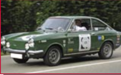
Typ: Fiat 850 Coupe, 1052 ccm, 85 PS Baujahr: 1969 M Ort: Urbach Lange, Andreas D Traub, Volker D