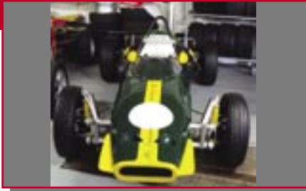
Typ: Mc Namara Formel V, 1300 ccm, 75 PS Baujahr: 1969 M Ort: Buch Ritzisried Egger, Wendelin D