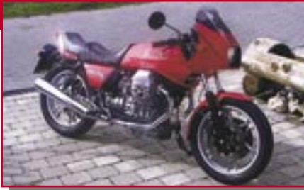
Typ: Moto Guzzi Le Mans 3, 1000 ccm, 80 PS Martin, Max D Ort: Tiefenbach