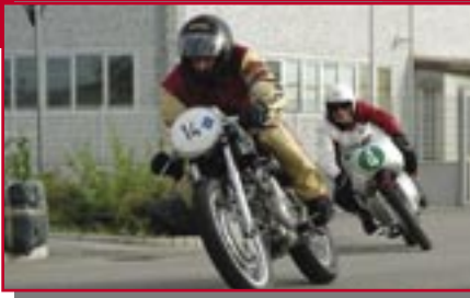
Typ: Aermacchi 350 Spezial, 350 ccm, 30 PS Baujahr: 1970 M Ort: Kalttern Sölva, Hubert I