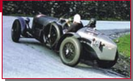
Typ: Talbot Barracq Sport, 3460 ccm, 120 PS Baujahr: 1932 M Ort: Zürich Rossetti, Gian-Pietro CH