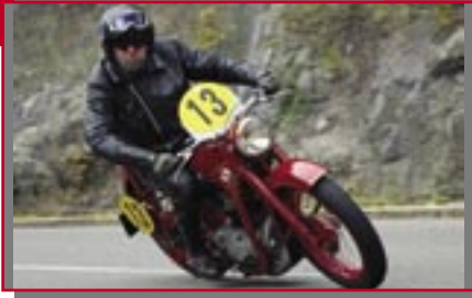
Typ: EMW R 35/3, 340 ccm, 14 PS Baujahr: 1952 M Ort: Nentershausen Ewald, Horst D