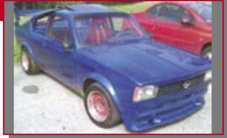
Typ: Opel Kadett C Coupe, 1998 ccm, 191 PS Baujahr: 1976 M Ort: Nesselwang Csauth, Peter D Pleier, Wolfgang D