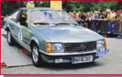
Typ: Opel Monza 2,8 S, 2753 ccm, 158 PS Baujahr: 1980 R Ort: Waldkraiburg Lode, Brigitte D Lode, Arnulf D