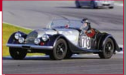
Typ: Morgan +8, 3500 ccm, 200 PS Baujahr: 1969 M Ort: Dubendorf Sigrist, Francis CH