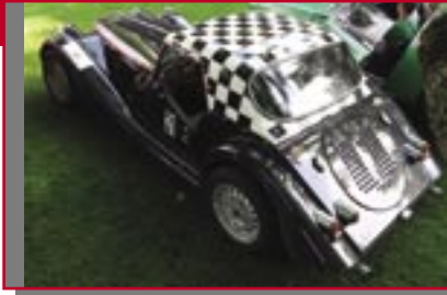
Typ: Morgan +8, 4200 ccm, 200 PS Baujahr: 1972 M Ort: Satteins Schwarz, Dieter A Wölfle, Michaela A