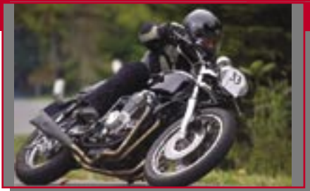
Typ: Honda CB 750 four, 750 ccm, 68 PS Baujahr: 1972 M Ort: Hörbranz Telian, Jürgen A