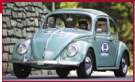
Typ: VW 11 De Luxe, 1600 ccm, 75 PS Baujahr: 1960 M Ort: St. Moritz Kammermann, J. Daniel CH