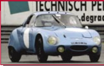
Typ: Rene Bonnet GT Aerodjet, 1000 ccm, 85 PS Baujahr: 1964 M Ort: Ec Deil van de Grint, Kees NL