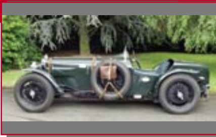
Typ: Alvis Speed 20, 2700 ccm, 80 PS Baujahr: 1934 R+M Ort: Rheinbach Krings, Wilfried D