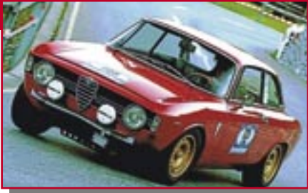
Typ: Alfa Romeo Giulia Sprint GT, 1600 ccm, 109 PS Baujahr: 1967 M Ort: Feldmeilen Martellosio, Marco CH