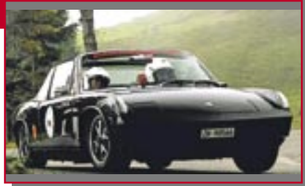
Typ: VW Porsche 914 2.0, 1971 ccm, 100 PS Baujahr: 1975 M Ort: Bergdietikon Uebelhard, Daniel CH Bücher-Uebelh., Ursula CH