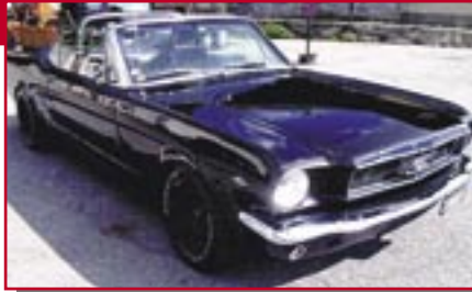
Typ: Ford Mustang Cabrio, 4728 ccm, 240 PS Baujahr: 1965 M Ort: Maloya Vonmoos, Christofel CH