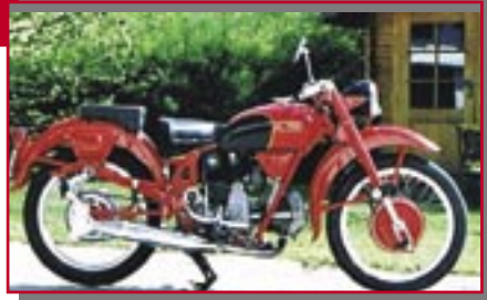
Typ: Moto Guzzi Airone Sport, 250 ccm, 12 PS Baujahr: 1952 M Ort: Sonthofen Neiltz, Sigurd D