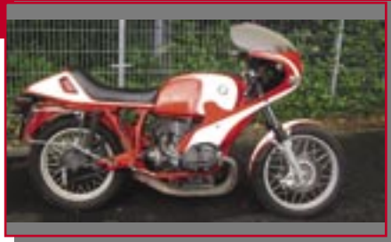
Typ: BMW R 60/6, 900 ccm, 40 PS Baujahr: 1976 M Ort: Wegberg Reinl, Werner D