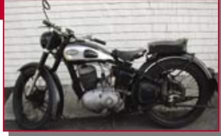
Typ: Triumph BDO 250 S, 246 ccm, 12 PS Baujahr: 1952 M Ort: Oy-Mittelberg Eckstein, Walter D