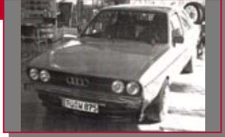
Typ: Audi 80, 1600 ccm, 110 PS Baujahr: 1975 M Ort: Tübingen Wandel, Thomas D