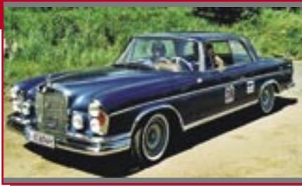
Typ: Mercedes 250 SE Coupe, 2500 ccm, 150 PS Baujahr: 1965 R Ort: Nürnberg Stadlmayer, Helmut D Stadlmayer, Christa D