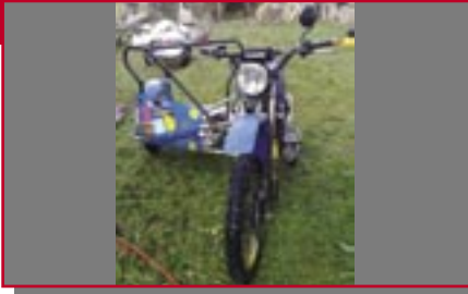
Typ: Roth-EML GS 3, 550 ccm, 50 PS Baujahr: 1979 M Ort: Unterjoch Haug, Fabian D