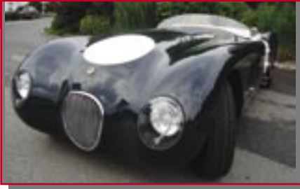
Typ: Jaguar Proteus C-Type, 4200 ccm, 250 PS Baujahr: 1961 M Ort: Vogt Ibele, Ralf D Werner Mayer D