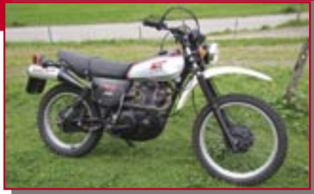
Typ: Yamaha XT 500, PS 27 Baujahr: 1977 M Ort: Unterjoch Gerung, Peter D