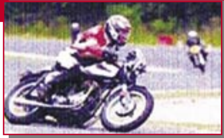
Typ: Tri BSA, 750 ccm, 50 PS Baujahr: 1956 M Ort: Weitnau-Hofen Schünemann, Karl-Ernst D