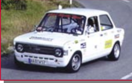
Typ: Fiat 128 Rallye, 1100 ccm, 100 PS Baujahr: 1975 M Ort: Bettringen Waldraff, Timo D