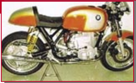
Typ: BMW R 90 S, 900 ccm, 70 PS Baujahr: 1973 M Ort: Altach Stückler, Konrad A