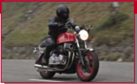
Typ: Münch 1200 TTS, 1167 ccm, 88 PS Baujahr: 1973 M Ort: Heiningen Deiss, Hans-Joachim D