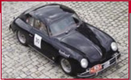
Typ: Porsche 356 A Coupe, 1600 ccm, 75 PS Baujahr: 1958 M Ort: Zürich Morf, Tom CH Zähnlner René