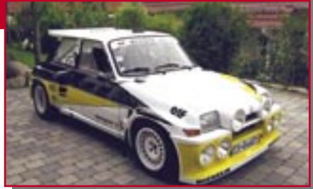
Typ: Renault Maxi Turbo, 1527 ccm, 350 PS Baujahr: 1983 Ort: Weilheim Claus, Timo D Pixner, Max D