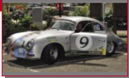
Typ: Porsche 356 A, 1650 ccm, 95 PS Baujahr: 1958 R+M Ort: Auer Kofler, Fuzzy I Chiusole, Andy I