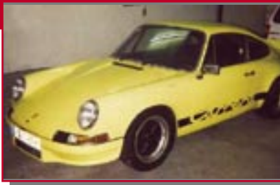
Typ: Porsche 911 RS, 2700, 210 PS Baujahr: 1973 M Ort: Ottobrunn Blomann, Wolfgang D Blomann, Monica D