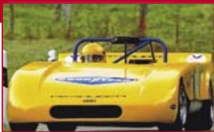
Typ: Sauber C1, 1000 ccm, 132 PS Baujahr: 1970 M Ort: Herzogenbuchsee Kilchenmann, Max CH