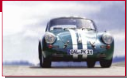
Typ: Porsche 356 B, 1600 ccm, 90 PS Baujahr: 1963 R + M Ort: Nesselwang Porsche, Kurt D Mair, Hermann D