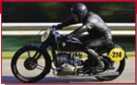
Typ: BMW R5 SS, 500 ccm, 36 PS Baujahr: 1936 M Ort: Ingolstadt Schranz, Fredi D