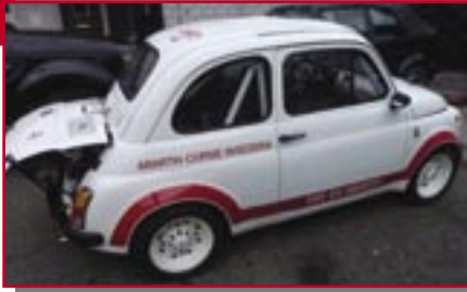
Typ: Fiat Abarth 595 SS Competizione, 595 ccm, 40 PS Baujahr: 1970 M Ort: Suhr Strässle, Rolf CH