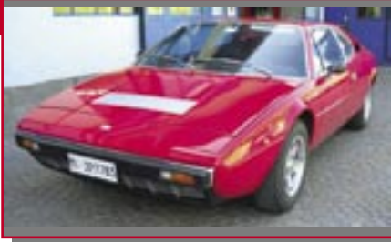
Typ: Ferrari Dino 208 GT4, 2000 ccm, 177 PS Baujahr: 1980 Ort: St. Leonhard-Passeier Freitag, Harald I