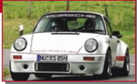
Typ: Porsche 911 SCRS, 3000 ccm, 220 PS Baujahr: 1979 M Ort: Neu Ulm Volk, Joachim D Volk, Regina D