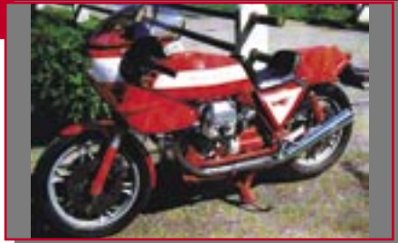
Typ: Moto Guzzi 850 Le Mans, 950 ccm, 76 PS Hafner, Günther D Ort: Obermaiselstein