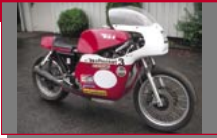
Typ: BSA Rocket 3, 870 ccm, 80 PS Baujahr: 1970 M Ort: Altach Gunz, Josef A