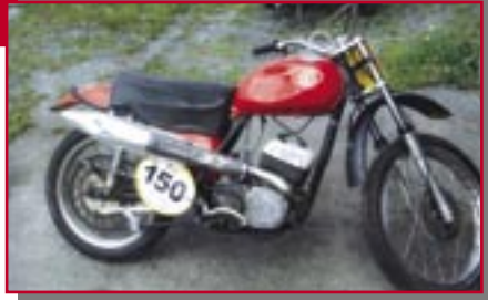
Typ: CZ 11C, 250 ccm, 34 PS Baujahr: 1969 M Ort: Bad Ragaz Zai, Ruedi CH