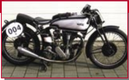
Typ: Norton Inter Racing, 350 ccm, 28 PS Baujahr: 1938 M Ort: Tübingen Maier, Klaus D