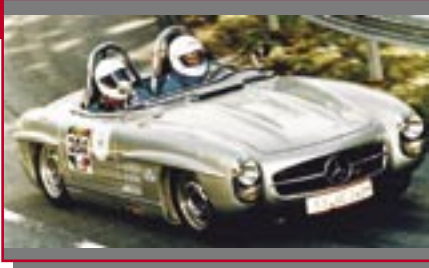
Typ: Daimler Benz 300 SLS, 2975 ccm, 215 PS Baujahr: 1957 M Ort: Bissingen Clauss, Ulrich D