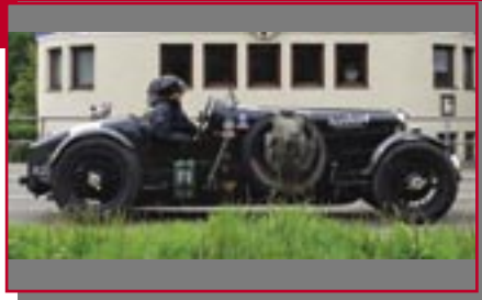
Typ: Alvis 12/70 Special, 1882 ccm 90 PS Baujahr: 1938 R + M Ort: Rapperswil Brumm, Dede D Lambert, Sylke D