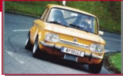
Typ: NSU TTs, 1300 ccm, 100 PS Baujahr: 1972 M Ort: Hörbranz Telian, Markus A