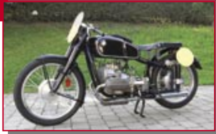
Typ: BMW R 51 RS, 500 ccm, 85 PS Baujahr: 1938 M Ort: Immenstadt Schwarzmann, Jürgen D