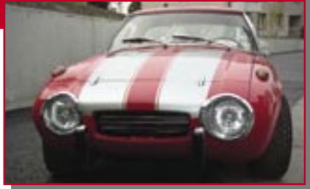
Typ: Toyota S 800 Sports, 800 ccm, 45 PS Baujahr: 1966 M Ort: Bäch Vitelli, Stefan CH Vitelli, Petra CH