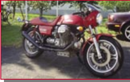
Typ: Moto Guzzi LM, 950 ccm, 75 PS Baujahr: 1978 M Ort: Rodgau Schütz, Armin D