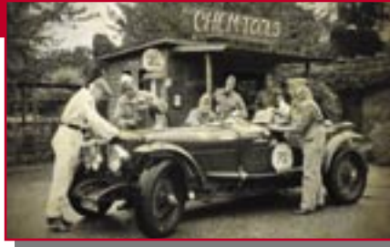
Typ: Alvis Speed 25, 3500 ccm, PS 120 Baujahr: 1937 Ort: Bad Vilbel Erlenbeck, Klaus D Vöpel, Christiane D