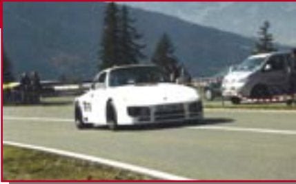
Typ: Porsche Turbo , 3300 ccm Baujahr: 1982 M Ort: Bad Hindelang Holzer, Andreas D