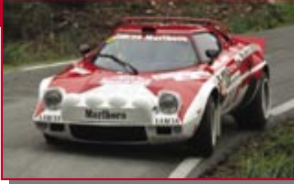
Typ: Lancia Stratos, 2465 ccm, 270 PS Baujahr: 1975 M Ort: Coburg Stoschek, Michael D Brasch, Guido D