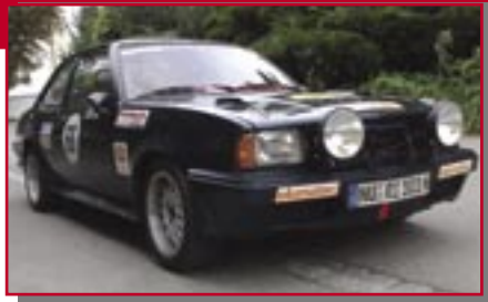
Typ: Opel Ascona, 2390 ccm, 98 PS Baujahr: 1977 R + M Ort: Illertissen Ries, Wolfgang D Ries, Wolfgang D