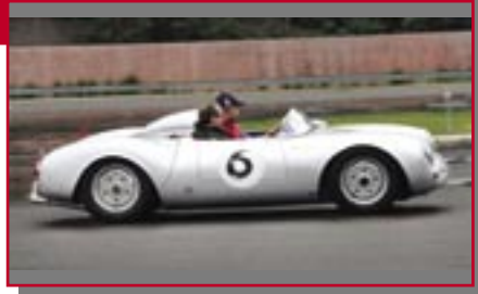
Typ: Porsche 550 RS Spyder, 1600 ccm, 110 PS Baujahr: 1955 R + M Ort: Bozen Mayr, Hanno I