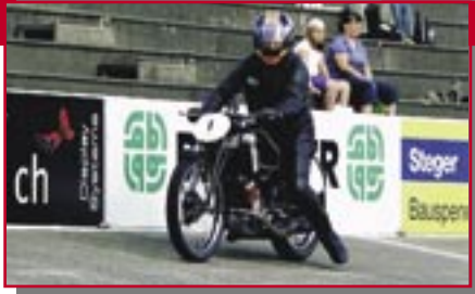
Typ: Scott Flying Squirell, 600 ccm, 30 PS Baujahr: 1929 M Ort: Langnau/Albis Bossert, Fredi CH