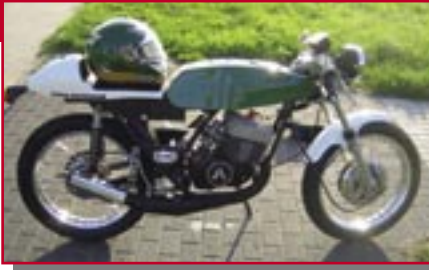
Typ: Aspes Yuma, 125 ccm, 25 PS Baujahr: 1976 M Ort: Oberhausen Sudowe, Peer D