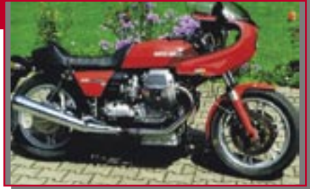
Typ: Moto Guzzi Le Mans 3, 838 ccm, 76 PS Stoll, Klaus D Ort: Burgberg