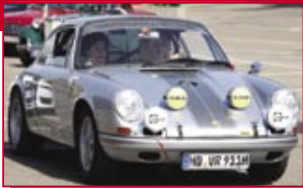
Typ: Porsche 911 T, 2200 ccm, 220 PS Baujahr: 1969 R + M Ort: Zuzenhausen Thomin, Dirk D Baschleben-Th., Heike D