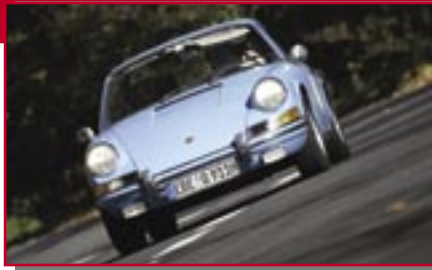
Typ: Porsche 911 T, 2200 ccm, 140 PS Baujahr: 1971 M Ort: Poing Hartmann, Rüdiger D Leichte, Erich D