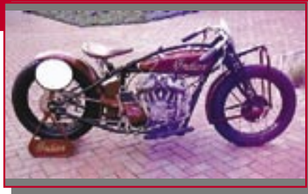
Typ: Indian, 750 ccm, 28 PS Baujahr: 1928 M Ort: Wennigsen Krüger, Kurt D