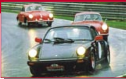
Typ: Porsche 911 SC, 3000 ccm, 180 PS Baujahr: 1979 M Ort: Sinsheim Reck, Karl-Heinz D Wagner, Daniel D