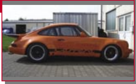
Typ: Porsche 911 SC, 3200 ccm, 230 PS Baujahr: 1977 M Ort: Esslingen Blumenstock, Eberhard D Müh, Wolfgang D