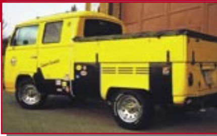
Typ: VW Doka, 2400 ccm, 140 PS Baujahr: 1979 M Ort: Eislingen Schwenk, Marko D