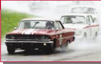
Typ: Ford Galaxie 500, 7013 ccm, 550 PS Baujahr: 1963 M Ort: Adliswil Stoop, Ruedi CH Boller, Alexander CH