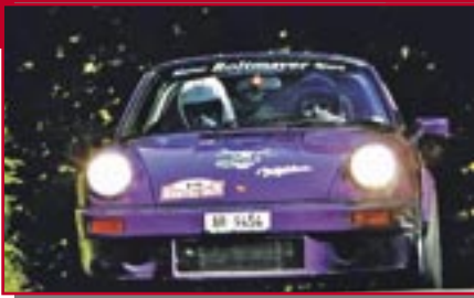
Typ: Porsche 911 Carrera, 3000 ccm, 310 PS Baujahr: 1974 M Ort: Herisau Wetter, George CH Breu, Peter CH