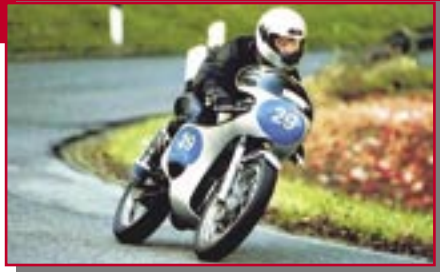
Typ: MZHB 250 Re, 250 ccm, 40 PS Baujahr: 1970 R Ort: Stiefenhofen Köhler, Ole D