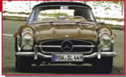
Typ: Mercedes Benz 300 SL Roadster, 3000 ccm, 215 PS Baujahr: 1960 R Ort: Visselhövede Winkelmann, Dieter D Reiss, Helmut USA