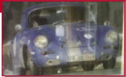
Typ: Porsche 356, 1600 ccm, PS 100 Baujahr: 1965 M Ort: Oberried Birsner Ulrich D Birsner Marc D