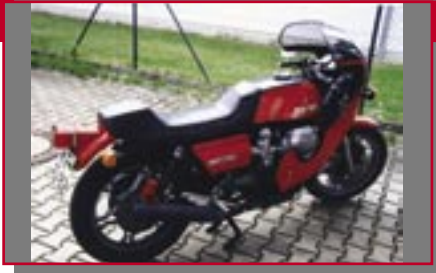
Typ: Moto Guzzi Le Mans 1, 850 ccm, 78 PS Baujahr: 1976 M Ort: Kaufbeuren Schlichting, Peter D