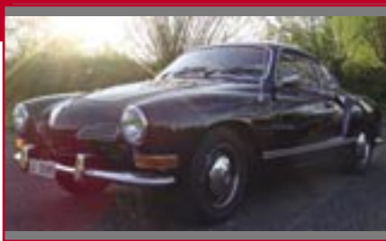
Typ: VW Kahrman Ghia, 1423 ccm, 44 PS Baujahr: 1969 M Ort: Bäch Ziegler, Marc CH