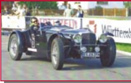
Typ: MG TC, 1250 ccm, 53 PS Baujahr: 1946 R Ort: Esslingen Blumenstock, Eberhard D Müh, Wolfgang D