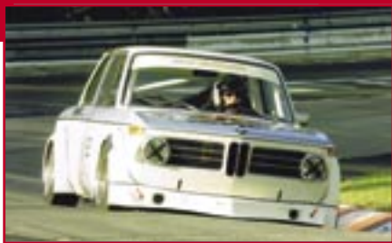
Typ: BMW 2002 Ti, 2000 ccm, 180 PS Baujahr: 1969 M Ort: Weiden Walterscheid-Müller, Herbert D