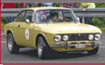
Typ: Alfa Romeo GTV, 1962 ccm, 130 PS Baujahr: 1969 M Ort: Rufi/Schänis Maag, Alwin CH Maag, Silvio CH