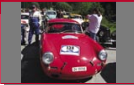
Typ: Porsche 356 SC, 1600 ccm, 95 PS Baujahr: 1964 R + M Ort: Küsnacht Oechsle, Christopher CH Oechsle, Caroline CH