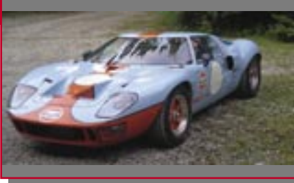
Typ: Ford GT 40, 5700 ccm, 350 PS Baujahr: 1969 M Ort: Seedorf Kennel, Paul CH Kennel, Jeanette CH