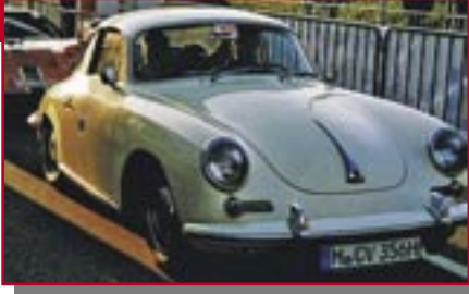
Typ: Porsche 356 C, 1400 ccm, 75 PS Baujahr: 1965 M Ort: Sonthofen Weidhaas, Udo D Weidhaas, Ursula D