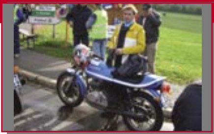
Typ: Ducati SD 500, 493 ccm, 44 PS Baujahr: 1978 M Ort: Stuttgart Meinhardt, Uwe D