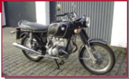
Typ: BMW R 50/5, 500 ccm, 32 PS Baujahr: 1971 R Ort: Wegberg Reinl, Werner D