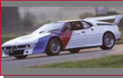
Typ: BMW M1, 3500 ccm, 300 PS Baujahr: 1979 M Ort: Schramberg Stein, Hannes