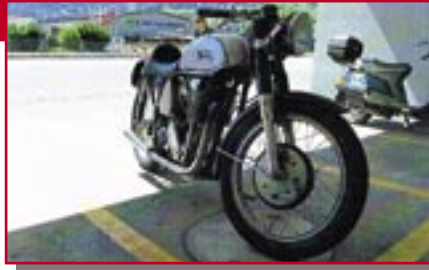
Typ: Norton Manx, 500 ccm, 40 PS Baujahr: 1949 R Ort: Eichberg Jud, Claudia CH