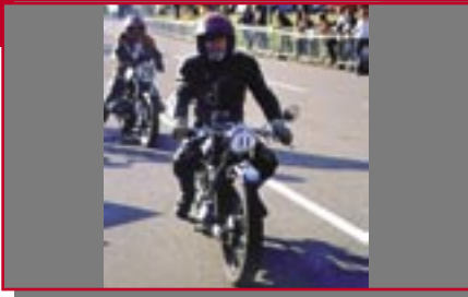
Typ: NSU Max, 250 ccm, 17 PS Baujahr: 1954 M Ort: Bad Hindelang Heim, Max D