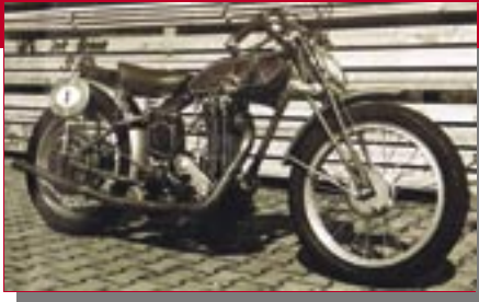
Typ: Imperia Sport, 500 ccm, 29 PS Baujahr: 1928 M Ort: Wildpoldsried Stegmaier, Bendikt D