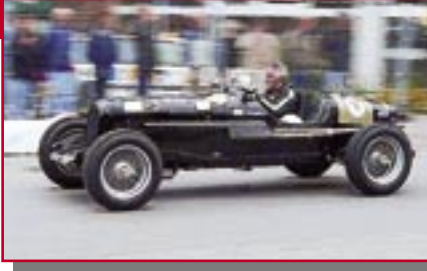
Typ: Lagonda Rapier, 1500 ccm, 150 PS Baujahr: 1934 M Ort: Ammerswil Amweg, Fredy CH