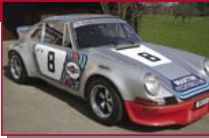
Typ: Porsche 911 RSR, 2800 ccm, 280 PS Baujahr: 1973 M Ort: Freidorf Duschletta, Duschi B. CH