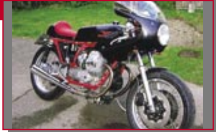
Typ: Moto Guzzi V50 Monza, 490 ccm, 49 PS Hafner, Gerhard D Ort: Obermaiselstein