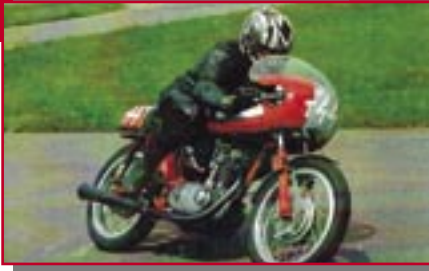
Typ: Ducati MK3, 250 ccm, 24 PS Baujahr: 1969 M Ort: Burghaun Schmidt, Claudia D