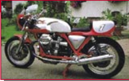
Typ: Moto Guzzi LM2, 500 ccm, 76 PS Grauke, Wilfried D Ort: Fischen