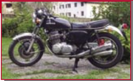
Typ: Honda CB 750, 750 ccm, 63 PS Baujahr: 1973 M Ort: Innerbraz Descher, Yannick A