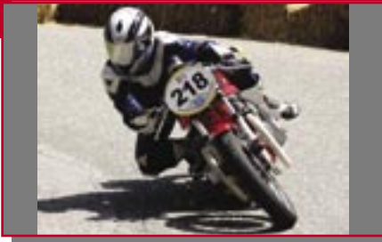
Typ: Honda HRC Corsa, 500 ccm, 50 PS Baujahr: 1974 Ort: Brixen Trombin, Manuel I