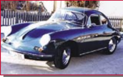
Typ: Porsche 356 BS 90, 1571 ccm, 90 PS Baujahr: 1960 R Ort: Waltenhofen Lang, Wolfgang D Lang, Simon D