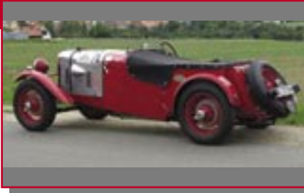
Typ: Alvis 12/70, 1842 ccm, 80 PS Baujahr: 1938 M Ort: Schwabach Mutschler, Jan D