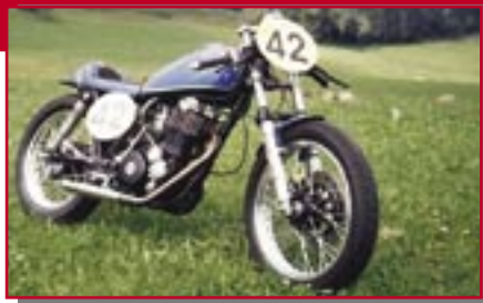
Typ: Yamaha SR 500, 500 ccm, 33 PS Baujahr: 1978 M Ort: Ofterschwang Müller, Fredl D