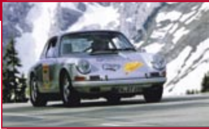
Typ: Porsche 911, 2000 ccm, 185 PS Baujahr: 1965 M Ort: Weiden Neumann, Thomas D