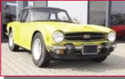
Typ: British Leyland TR 6, 2500 ccm, 140 PS Baujahr: 1976 R + M Ort: Stromberg Teuber, Stefan D Göttert, Peter D