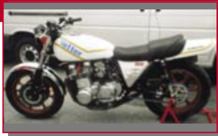
Typ: Kawasaki Z 1000 AI, 1135 ccm, 120 PS Baujahr: 1977 M Ort: Götzis Benzer, Mario A