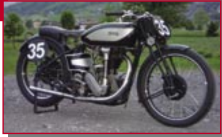
Typ: Norton International, 490 ccm, 28 PS Baujahr: 1935 M Ort: Ibach Treichler, Max CH